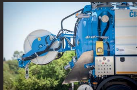
Hochdrucktrommel in Arbeitsposition